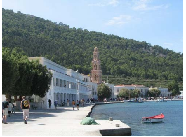
DAS KLOSTER PANORMOS