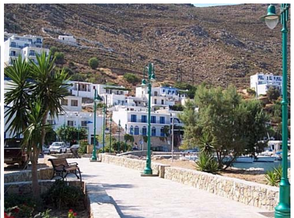
TILOS WÄRE EINEN ABSTECHER WERT