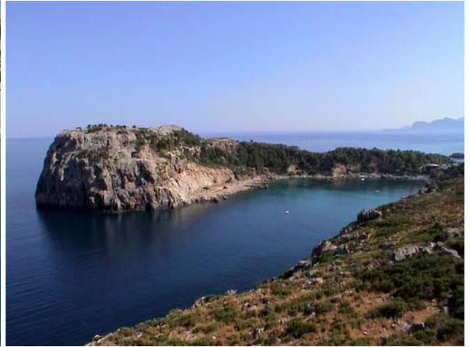
ANTHONY QUINN BAY