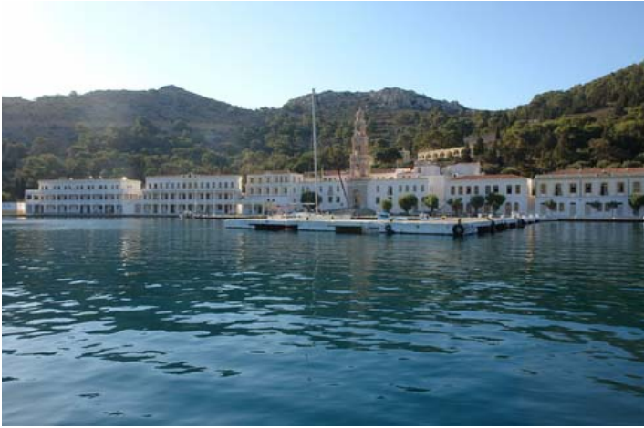
DIE BUCHT VON PANORMITIS