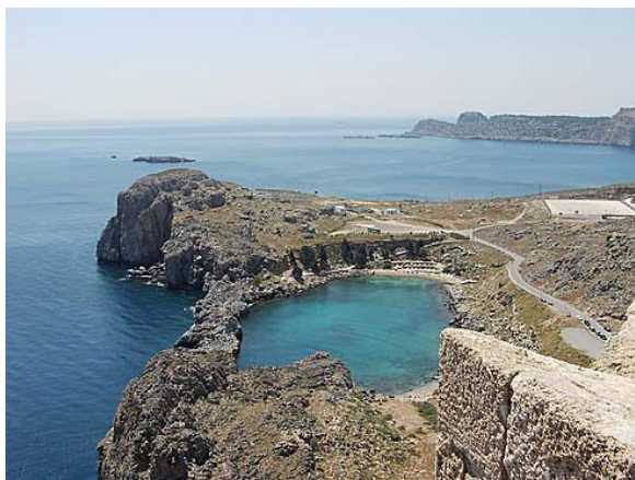
St. PAULS BAY